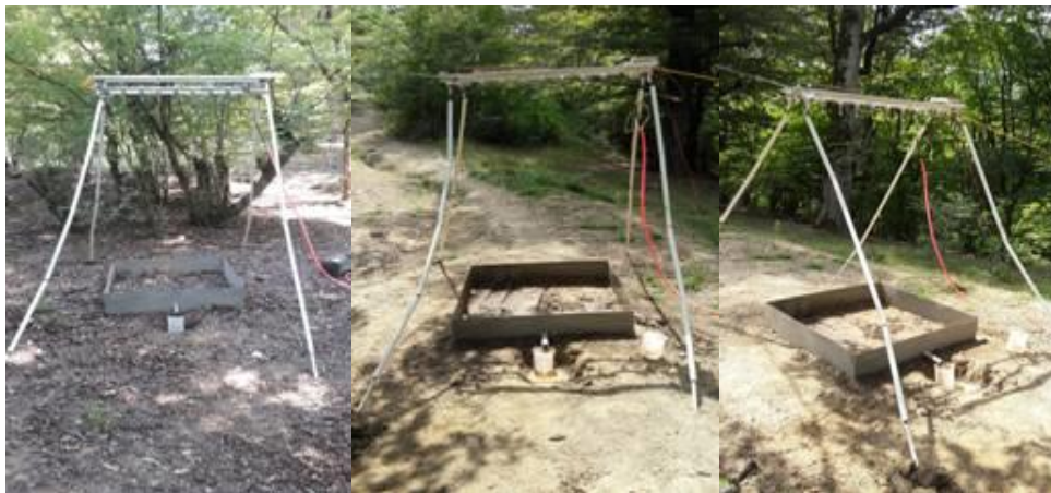
شکل ۲- استقرار شبیه‌ساز باران در جنگل (شکل راست)، رد چرخ (شکل وسط) و مرکز مسیر چوب‌کشی (شکل چپ) Figure 2. Installation of the rain simulator in the forest (right picture), wheel track (middle picture), and the center of the skid trail (left picture)

طبق بررسی‌های میدانی و این که کمینه و بیشینه شیب طولی در جهت چوب‌کشی رو به بالا به ترتیب کمتر از ۵ و ۲۵ درصد بود، بنابراین مسیر چوب‌کشی به پنج طبقه شیب کمتر از ۵، ۱۰-۵، ۱۵-۱۰، ۲۰-۱۵ و ۲۵-۲۰ درصد با استفاده از شیب‌سنج سونتو در روی مسیر چوب‌کشی تقسیم‌بندی شد (شیب عرضی ۵ درصد و ثابت در نظر گرفته شد). قبل از شروع شبیه‌سازی باران جهت تعیین ویژگی‌های خاک، رطوبت و مقاومت به نفوذ خاک در شیب‌های مختلف در سه منطقه رد چرخ، مرکز مسیر و جنگل طبیعی برآورد گردید که این خصوصیات در هر منطقه معنی‌دار نبودند و فقط در بین مناطق مختلف معنی‌دار بودند. با توجه به این موضوع، فقط متغیر شیب در سه منطقه بر مقدار رواناب و هدررفت خاک دخالت داده شد. در هر شبیه‌سازی بارش، زمان شروع رواناب (فاصله زمانی آغاز بارش تا آغاز رواناب) با استفاده از کرومومتر و حجم رواناب تولیدی از طریق خروجی پلات و با استفاده از بشر طی زمان