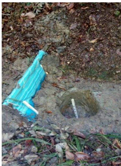
شکل ۲- تله رسوب‌گیر Figure 2. Sediment trap

توزیع داده‌ها با آزمون شاپیرو-ویلک (Shapiro-Wilk-test) و تساوی واریانس‌ها با آزمون لون (Levene's test) بررسی شد. در صورت نرمال نبودن توزیع داده‌ها و عدم تساوی واریانس‌ها از آزمون ناپارامتریک کروسکال-والیس (Kruskal-Wallis) استفاده شد. در رابطه با متغیرهای مستقل از رویه ANOVA و آزمون توکی (Tukey) استفاده شد. تجزیه همبستگی به کمک آزمون پیرسون، ترسیم نمودارها در نرم‌افزار Excel 2016 و کلیه تجزیه و تحلیل‌های آماری نیز در نرم‌افزار SAS 9.4 انجام پذیرفت (۱۷).