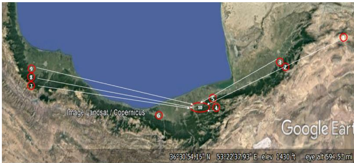
شکل ۱- نه منطقه جمع‌آوری بذر و مناطق تولید نهال و اجرای طرح (شماره ۱۰ نهالستان محل تحقیق بوده و اطلاعات و مختصات محل‌های جمع‌آوری بذر و نهالستان در جدول یک آمده است)

رئبسی و همکاران (۲۰) در بررسی تنوع ژنتیکی پنج جمعیت از بلندمازو از طریق فعالیت آنزیم پروکسیداز نشان دادند که بین رویشگاه‌های مختلف تنوع ژنتیکی وجود داشته و بلندمازو در ارتفاعات اکوتیپ تشکیل می‌دهد. تابنده و همکاران (۲۷) سیئوژنتیک شش جمعیت از بلندمازو شمال ایران را مورد بررسی قرار داده و نتیجه‌گیری کردند که طول کروموزوم و طول بازوی بلند بیشترین نقش را در ایجاد تنوع بلندمازو دارند. در خارج از ایران اکثر مطالعات انجام شده در خصوص گونه‌های جنس بلوط به صورت جامع در سطح حداقل یک کشور و در برخی مواقع در چند کشور انجام شده است. از این رو برای بسیاری از گونه‌های درختی، مسافت‌های مجاز انتقال بذر و نهال با رویکرد تعدیل آثار تغییر اقلیم و افزایش سازگاری مورد مطالعه قرار گرفت. در ایران مطالعات مربوط به تعیین مبداء‌های مناسب بذر از طرفی انگشت‌شمار بوده و از طرف دیگر به صورت محلی و حداکثر به صورت منطقه‌ای اجرا شده اند. برای بلندمازو تنها چهار مطالعه برای دو نهالستان تولید نهال در گیلان توسط نقشی و همکاران (۱۷) و میره‌کی و همکاران (۱۵) و برای دو نهالستان در مازندران توسط تابنده و همکاران (۲۶) و احمدی (۱) انجام شد. در صورتی که در ناحیه رویشی هیرکانی حداقل ۵۰ نهالستان تولید نهال جنگلی وجود دارد. به همین دلیل خلاء ارزیابی‌های منطقه‌ای مبداء بذر برای تعیین شعاع انتقال بذر و نهال و نیز اثرات پایه‌های مادری روی استقرار و رشد نهال‌های بلندمازو در نهالستان‌ها و جنگلکاری‌های محلی که رابطه مستقیم با تغییرات اقلیمی دارد کاملاً محسوس است. از این‌رو انجام پژوهش برای تعیین