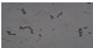
شکل ۶- آسک قارچ R. acerinum