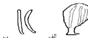
شکل ۵- الف: آسکوسپور، ب: آسک قارچ R. acerinum

تشخیص داده شد که با نتایج تحقیق کانون و همکاران (۵) و لاپوینت و بریسون (۱۲) در کشور آمریکا مطابقت دارد. قارچ‌های Rhytisma پارازیت هستند که روی برگ‌های نهاندانگان مشاهده می‌شوند (۱۱) و سبب بیماری در گونه‌های مختلف افرا می‌گردد (۱۲). معمولاً این