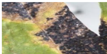
شکل ۲- استرومای قارچ R. acerinum روی برگ افراپلت

و روی سطح برگ جوانه می‌زنند و از راه روزنه‌ها وارد برگ‌ها می‌شوند (۶) و موجب آلودگی سلول‌های اپیدرم و مزوفیل می‌شوند. با رشد قارچ، سلول‌ها پاره شده و استرومایی با پوشش سیاه رنگ تشکیل می‌دهند. مرحله پریتسیوم،