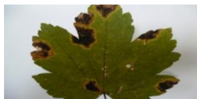
شکل ۱- بیماری لکه قیری روی برگ درخت افرا