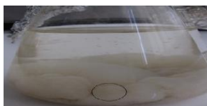
شکل ۴- توده‌های میسیلیومی حاصل از کشت قارچ R. acerinum