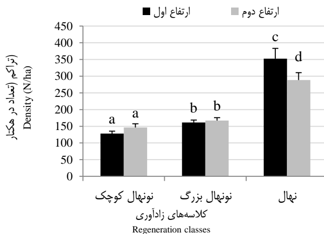
شکل ۲- میانگین تراکم زادآوری کرب به تفکیک کلاسه‌های زادآوری در طبقات ارتفاعی Figure 2. Average regeneration density by different classes at altitude ranges

نتایج نشان داد که تراکم زادآوری گونه کرب در کلاسه نهال در طبقه ارتفاعی اول (۳۵۲±۳۰/۷۵) به طور معنی‌داری (۰/۰۵) بیشتر از طبقه ارتفاعی دوم (۲۸۸±۲۲/۲۶) بود (Sig= ۰/۰۰۴، t = ۸/۹۳۲). همچنین تراکم زادآوری در کلاسه‌های نونهال کوچک و نونهال بزرگ در ارتفاع دوم (به ترتیب ۱۴۶±۸/۶۲ و ۱۴۶±۱۱/۱۷) بیشتر از ارتفاع اول (به ترتیب ۱۶۱±۷/۳۱ و ۱۲۸±۶/۹۶) بود اما این تفاوت معنی‌دار نبود (به ترتیب ۲/۳۲۰، t = ۰/۱۳۳، Sig= ۰/۱۹۴). به طور کلی زادآوری کلاسه نهال دارای بیشترین فراوانی در کل کلاسه‌ها بود (شکل ۲).