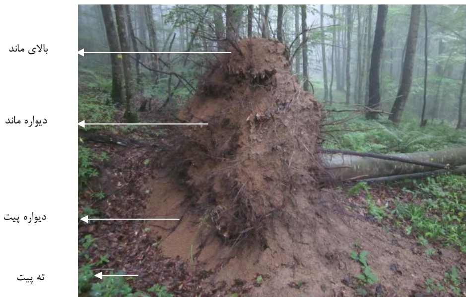
شکل ۱- میکروتوپوگرافی پیت و ماند حاصل از ریشه‌کن شدن درخت