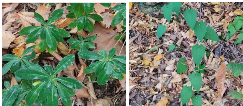
شکل ۲- نمونه‌ای از پوشش علفی منطقه مورد مطالعه Figure 2. An example of grass cover in the study area

متوسط بارش سالیانه آن ۶۱۴/۹ میلی‌متر با متوسط ماهیانه ۵۱/۲۴ میلی‌متر است. پربارش‌ترین ماه آبان ۲۰۴/۸ و کم بارش‌ترین ماه مرداد با ۱۲/۳ میلی‌متر هستند. میانگین دمای سالانه ۳۴/۶۹ میلی‌متر که سردترین ماه سال بهمن ماه با دمای ۱۵/۷ درجه و گرم‌ترین ماه سال مرداد با ۵۶/۱ درجه سانتی‌گراد هستند. منطقه مورد مطالعه بر اساس تقسیمات انجام‌شده در قطعه ۲۵، سری ۴ از بخش ۴ نكاء چوب در حوضه آبخیز واقع گردیده است. مساحت کل سری، ۲۰۸۲/۴ هکتار با ناحیه جنگلی ۱۰۱۱/۶ هکتار و مساحت جنگل‌کاری شده ۳۰۴/۵ هکتار و گونه‌های درختی آن عبارت‌اند از راش، ممرز،