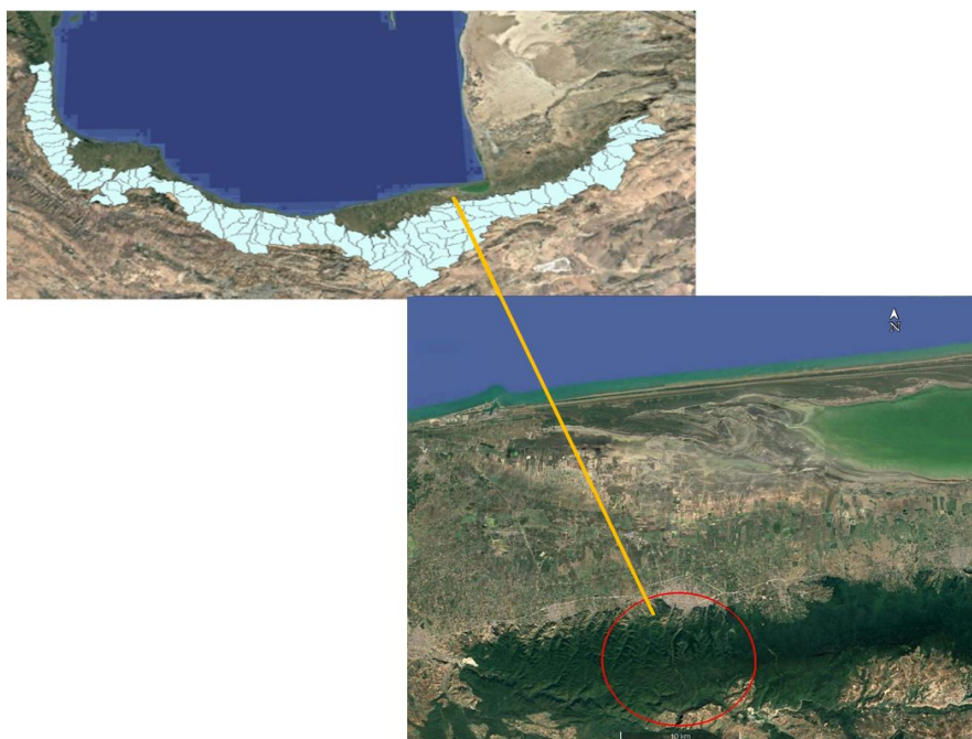
شکل ۱- موقعیت بخش ۴، سری ۴ طرح جنگل‌داری نکاچوب Figure 1. Location of section 4, series 4 of the Neka Chub forestry plan

توسکا، بلوط، شیردار، ون و گردو و سایر گونه‌های صنعتی و هیزمی (Forestry Plan Series 4, Section 4, Neka, 2012).