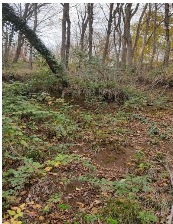
شکل ۳- منطقه لغزشی B Figure 3. Landslide B

در سال ۱۴۰۲، مناطق لغزشی در طی یک هفته جنگل‌گردشی و با استفاده از اطلاعات قرق‌بان‌ها شناسایی شدند. لغزش‌های مورد مطالعه در قطعه ۲۵ با مساحت ۶۳/۱ هکتار مورد اندازه‌گیری و مطالعه قرار گرفت. دو نقطه لغزشی به نام‌های نقطه A و B انتخاب شدند (شکل ۳). مورد اول در حدود ۶ سال و مورد دوم حدود ۸ سال از رخداد لغزش در آن‌ها سپری شده بود. آثار این لغزش که به صورت کم‌عمق اتفاق افتاده است هنوز مشهود هستند (جدول ۱). نمونه‌برداری به صورت منظم تصادفی با خطوط زیگزاگی و زاویه ۴۵ درجه روی منطقه لغزشی، با قطعه نمونه‌های و با کوادرات ۱×۱ متری انجام شد. در هر ناحیه لغزشی،