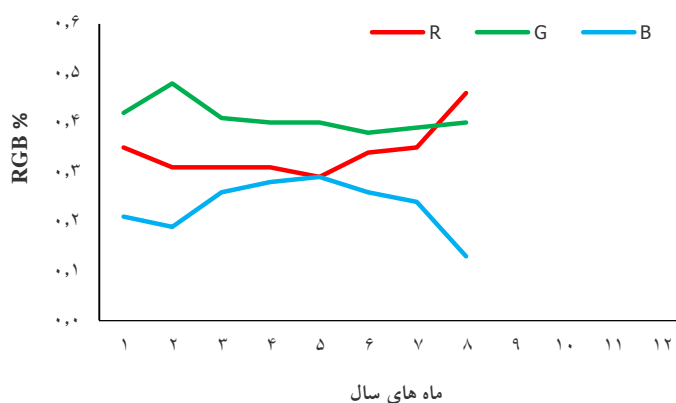
شکل ۲- تغییرات درصد RGB برگ درخت افاقیا در طول سال Figure 2. Changes of RGB% of leaf of Robinia pseudoacacia during year