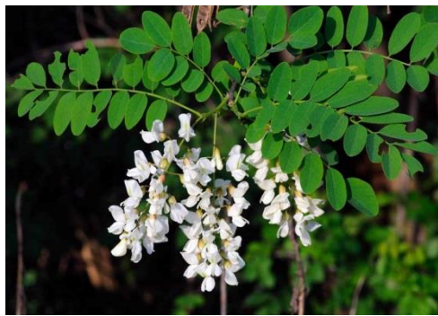
شکل ۱- درخت افاقیا Figure 1. Black Locust

درخت افاقیا ( Robinia pseudoacacia L.) با نام انگلیسی Black Locust از خانواده Papilionaceae درختی تقریباً بدون کرک با تنه‌ای با پوست قهوه‌ای عمیقاً شیاردار و