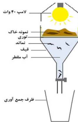
شکل ۱- جداسازی نماتدهای خاکی به روش قیف بیرمن