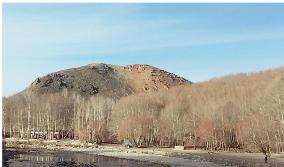
شکل ۱- تصویر توده‌های مورد بررسی Figure 1. A picture from study area

کشت دو گونه چنار و کبوده به صورت سنتی در غرب اصفهان رواج دارد. طبق آمار اداره کل منابع طبیعی استان اصفهان، حدود ۲۰۰۰ هکتار از اراضی این استان به کشت صنوبر اختصاص یافته که عمدتاً شامل Populus alba و همچنین Populus nigra بوده و در مجاورت رودخانه