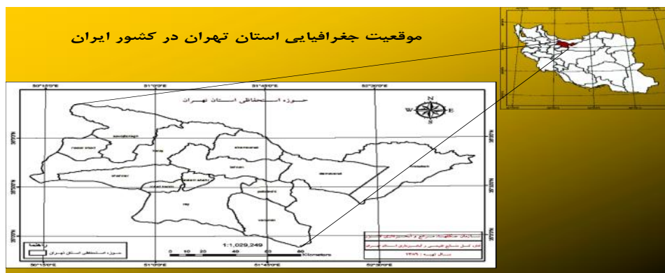
شکل ۱- نقشه محدوده منطقه مورد مطالعه

استقرار بنه با توجه به بازدیدهای میدانی صورت پذیرفته و واقعیت موجود در طبیعت به چهار حالت و شکل زیر قابل رویت بوده که شامل (۱) درختچه بادام: به معنی مواردی که بنه در اطراف و زیر درختچه بادام تجدید حیات نموده است، (۲) صخره سنگ: به معنی مواردی که بنه در کنار و زیر تخته سنگ‌ها تجدید حیات نموده است، (۳) فضای باز: به معنی مواردی که بنه در فضاهای باز و بدون هیچ گونه پناهی تجدید حیات نموده است و (۴) بنه: به معنی مواردی که بنه در زیر درختان مادری خود تجدید حیات نموده است، تفکیک و کدبندی شد. هم‌چنین متغیرهای رتبه‌ای درختان و زادآوری بنه شامل سلامت برگ، سلامت میوه و سلامت زادآوری که در ۳ کلاس خوب با شادابی بیش از ۷۰ درصد، متوسط بین ۴۰-۷۰ درصد و ضعیف کمتر از ۴۰ درصد دسته‌بندی شده بودند، مورد بررسی قرار گرفت. علاوه بر گونه بنه، تعداد، قطر تاج و ارتفاع درختچه بادام کوهی نیز به‌عنوان یکی از گونه‌های همراه مهم برداشت شد. هم‌چنین ارتفاع از سطح دریا، جهت و درصد شیب در هر یک از قطعات نمونه نیز ثبت شد.